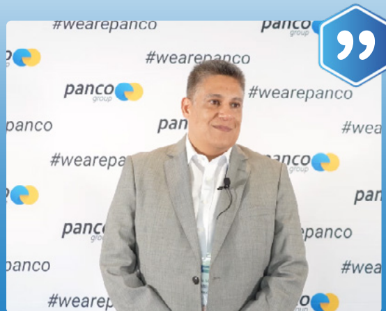
Fernando Muñoz / CLP Cargo y Aduana