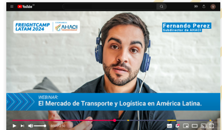
Contenido colaborativo como webinars