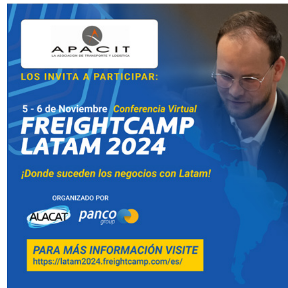
Post de LinkedIn o Instagram